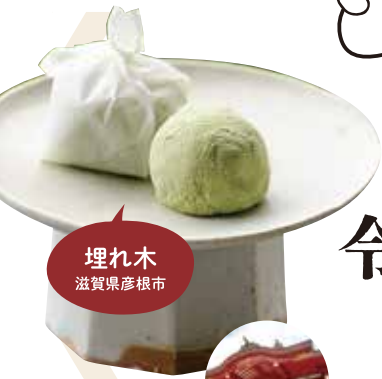
埋れ木 滋賀県彦根市